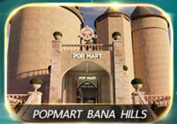
POPMART BANA HILLS

สัมผัสความงามหมู่บ้านฝรั่งเศสที่บานาฮิลล์ ช้อปปิ้ง POPMART