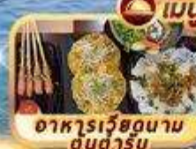
อาหารเวียดนาม ต้นตำรับ