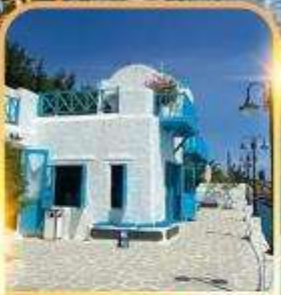
SON TRA MARINA CAFE