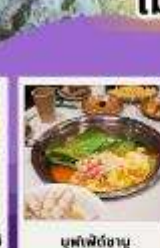
บุฟเฟ่ต์ถั่ว