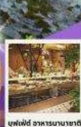
บุฟเฟ่ต์ อาหารนานาชาติ