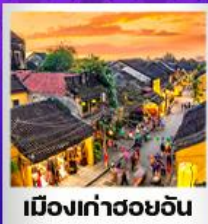
เมืองเก่าฮอยอัน