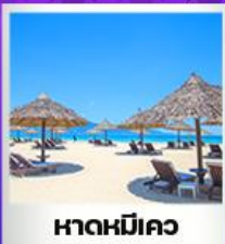
หาดหมีคว