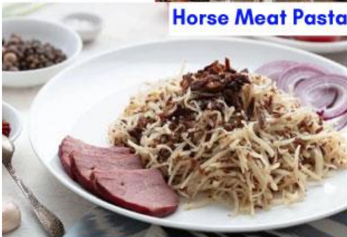
Horse Meat Pasta