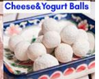
Cheese & Yogurt Balls