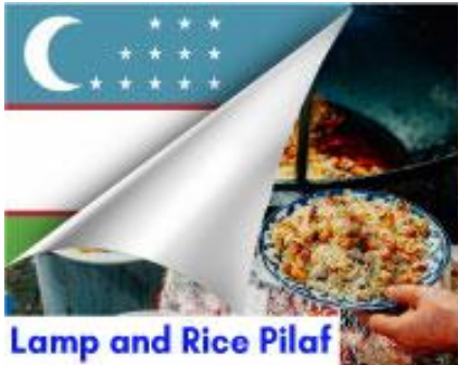
Lamp and Rice Pilaf