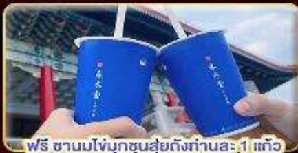
ฟรี ชาวมโซ่มุกชงสดถึงท่านละ 1 แก้ว

เที่ยวจุใจ เซ็คอินจุดไฮไลท์ บินบ่าย-กลับดึก