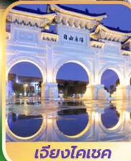
เจียงไคเชค