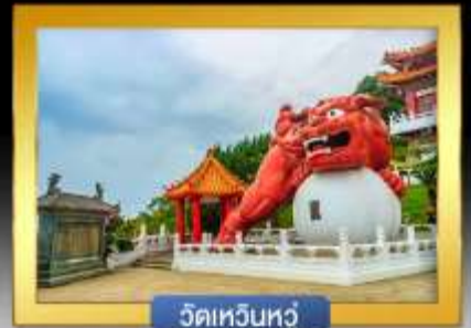
วัดเหวินหนู่