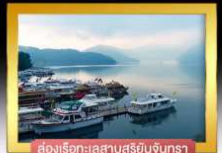
ส่องเรือทะเลสาบสุริยันจันทรา