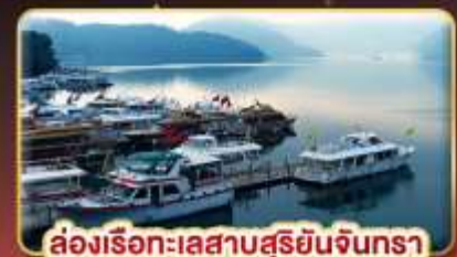
ล่องเรือทะเลสาบสุริยนจันตรา