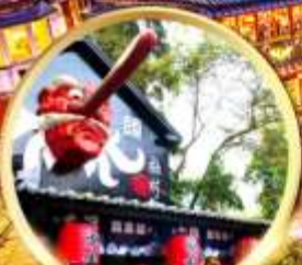
หมู่บ้านปิสางชิวโกว