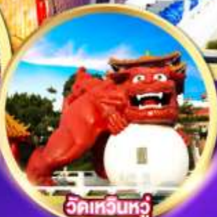
วัดเหวินหู่