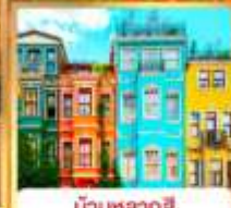
บ้านหลากัส คัสเลอร์ฟู่