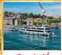
เรื่อเฟอรร์

เก็ยวัครบเส้นทงยอคัันยิม บัันเข้าทังเยัน เข้าชมสุหร่ายักัันคัมลัีก้า และล่องเรื่อเฟอรร์ ชมเทศก่าลทิวลัิปแห่งครฮัิสตัันบูล