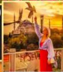
ลู่ฟ็กั๊อปปะเวันอิลลัซ