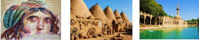
พิพิธภัณฑสถานชุกมา โมเสก บ้านแบบรวงผึ้ง ถ้ำอับราฮัม **พักที่ HARRAN HOTEL **