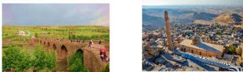
สะพานสิบโค้ง เมืองมาร์ดิน **ที่พัก KAYA NINOVA MARDIN HOTEL **