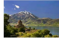
เมืองวาน ** ที่พัก RONESANS LIFE VAN **