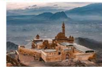
พระราชวังอิซฮาก พาชาร์ ** พักที่ WINTER CITY HOTEL **