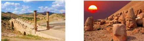
สะพานเซเวอร์ริน ชมพระอาทิตย์ตกดิน ** พักที่ EUPHRAT HOTEL NEMRUT **