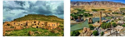
เมืองดารา เมืองฮาซันคีฟ ** ที่พัก THE CRATER HOTEL **