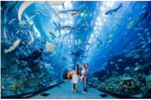
ต่างๆ ทั่วโลก

*** Sea. Aquarium(ยังไม่รวมค่าบัตร) (โปสดแจ๊งและชำระค่าบัตรก่อนเดินทาง ได้ในราคา ผู้ใหญ่ 1,350 บาท / เด็ก อายุต่ำกว่า 12ปี ราคา 1,190 บาท) S.E.A. Aquarium เป็นพิพิธภัณฑ์สัตว์น้ำเปิดใหม่ใหญ่ที่สุดในโลกกับ Marine Life Park จัดอันดับให้เป็นอควาเรียมใหญ่สุดในเอเชียตะวันออกเฉียงใต้ ถูกออกแบบให้เป็นอุโมงค์ใต้น้ำ สามารถบรรจุน้ำเค็มได้กว่า 45 ล้านลิตร รวมสัตว์ทะเลกว่า 800 สายพันธุ์ รวบรวมสัตว์น้ำกว่า 100,000 ตัว ตกแต่งด้วยซากปรักหักพังของเรือ ภายในได้จำลองความอุดมสมบูรณ์ของทะเล