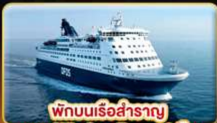
พักผ่อนเรือสำราญ แบบ Window Room 1 คืน