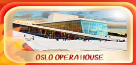
OSLO OPERA HOUSE