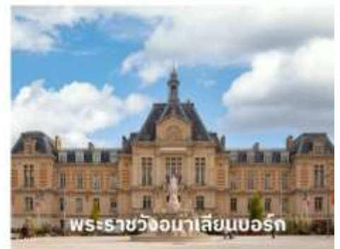
พระราชวังมาเลเซียนบอร์ก