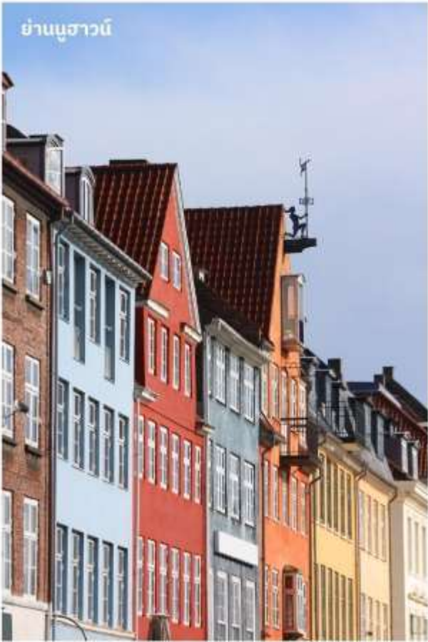
ย่านนูฮาวน์