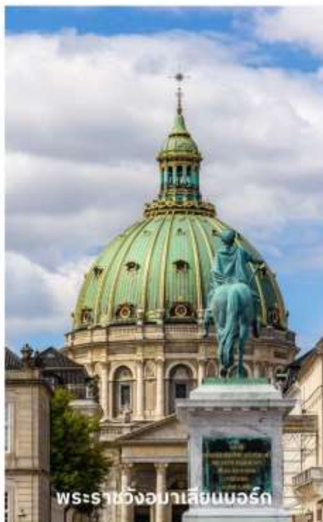
พระราชวังมาเลเซียนบอร์ก