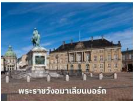
พระราชวังมาเลเซียนบอร์ก