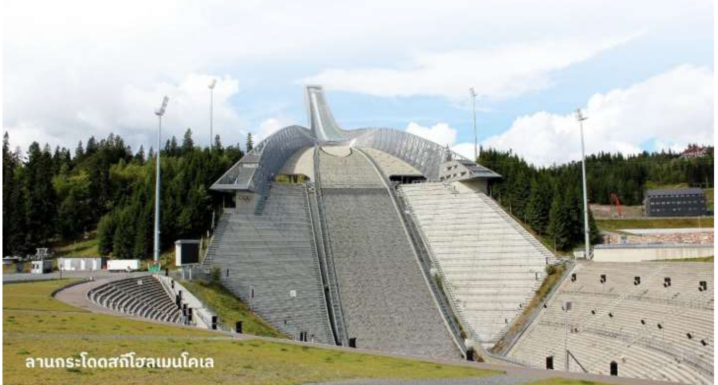
ลานกระโดดสกีโฮลเมนโคเลน

ตั้งอยู่ในเมืองออสโล ประเทศนอร์เวย์ เป็นหนึ่งในสถานที่ที่มีชื่อเสียงในวงการสกีกระโดด มีประวัติยาวนานและเป็นที่ยอมรับอย่างกว้างขวางในการแข่งขันสกีกระโดดและการแข่งขันกีฬาทูหนาวอื่นๆ นอกจากนี้ยังมีพิพิธภัณฑ์เกี่ยวกับกีฬาและศูนย์ข้อมูลเกี่ยวกับประวัติศาสตร์ของการสกีกระโดดให้ผู้เยี่ยมชมได้ศึกษาด้วย