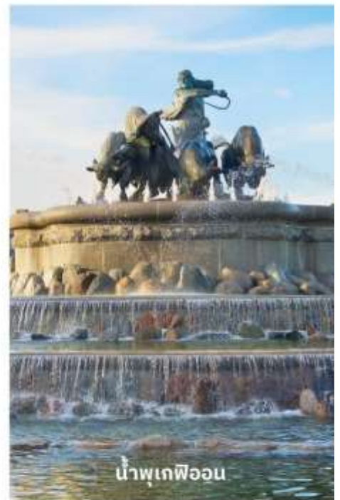
น้ำพุเทพีออน