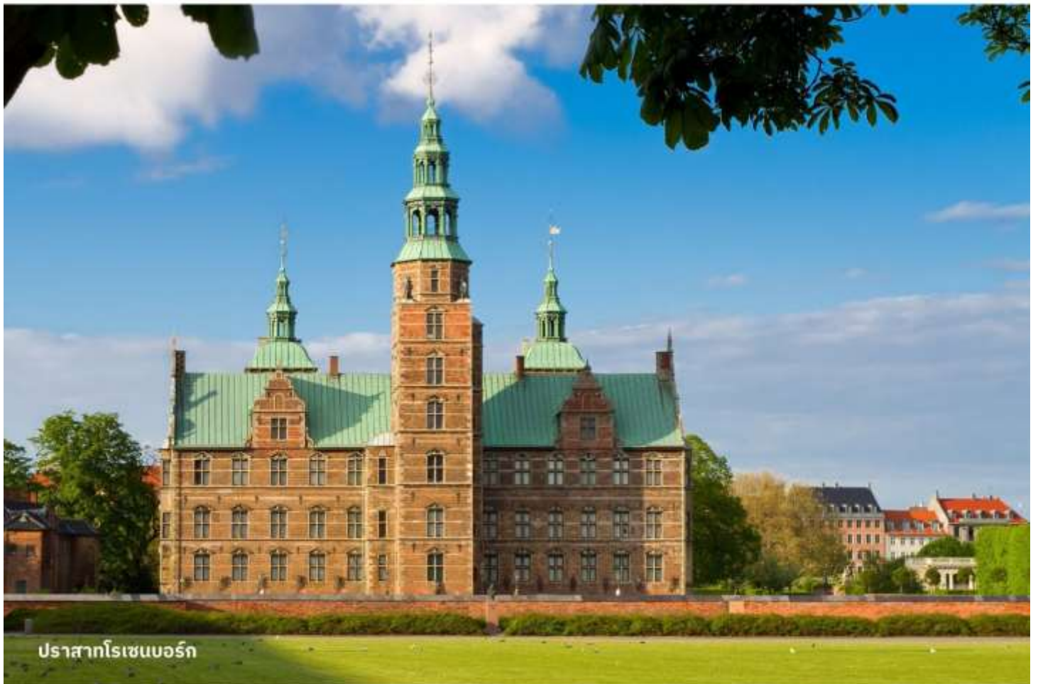
ปราสาทโรเซนบอร์ก

จากนั้นนำท่านเข้าชม ปราสาทโรเซนบอร์ก พระราชวังฤดูร้อนใจกลางเมืองโคเปนเฮเก้น เป็นพระราชวังที่มีอายุเก่าแก่กว่า 400 ปี โดยสถาปัตยกรรมของพระราชวังโรเซนเบิร์กนั้นได้รับอิทธิพลมาจากสถาปัตยกรรมรูปแบบเรอเนสซองส์ ซึ่งไฮไลท์สำคัญในการเข้าชมคือการชมเครื่องราชกกุธภัณฑ์ (The Crown Jewels) ของราชวงศ์เดนมาร์ก ซึ่งเป็นสมบัติล้ำค่าที่สุดที่จัดแสดงอยู่ที่นี้