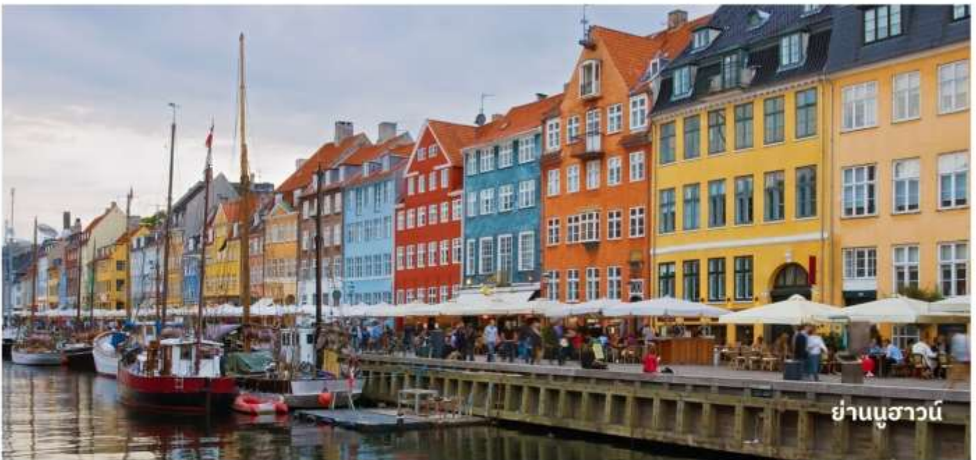
ย่านนูฮาวน์

จากนั้นนำท่าน ช้อปปิ้งสินค้าย่าน วอล์คกิ้งสตรีท หรือ ถนนสตรอยท์ ถนนช้อปปิ้งที่ยาวที่สุดในโลกเริ่มจากศาลาว่าการเมืองไปสิ้นสุดที่ Kongens Nytorv ที่มีสินค้าแบรนด์เนมชื่อดังจำนวนมากมายบนถนนเส้นนี้