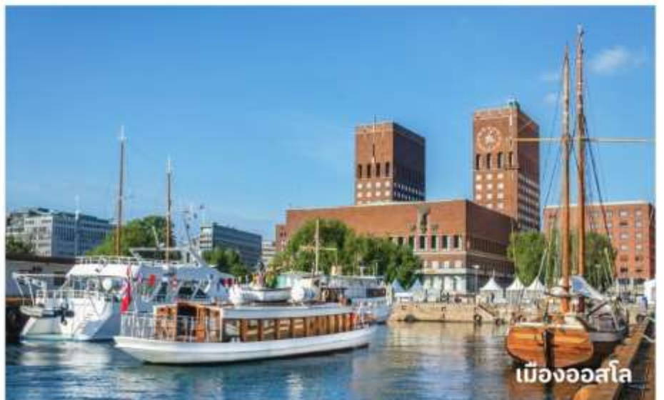
เมืองออสโล