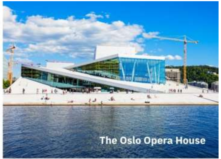
The Oslo Opera House

จากนั้นนำท่านถ่ายรูป The Oslo Opera House หนึ่งในโครงการปรับปรุงบริเวณชายฝั่งของออสโลให้เกิดเป็นพื้นที่ที่มีประโยชน์ ด้วยเงินทุนมหาศาล และการปรับผังการจราจรของชายฝั่งด้านตัวเมืองออสโล