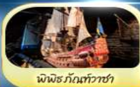
พิพิธภัณฑ์ทัวซ่า