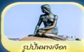
รูปปั้นนางเงือก