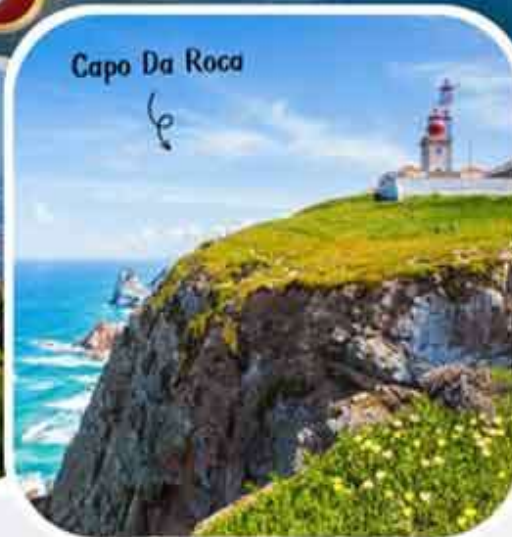
Capo Da Roca