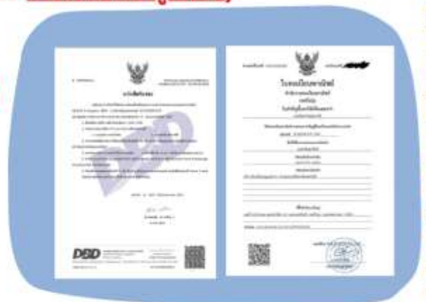
ตัวอย่างหนังสือจดทะเบียนบริษัทฯ และ ใบทะเบียนพาณิชย์