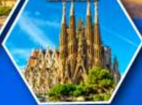
โบสถ์ซากราดา แฟมิลียา