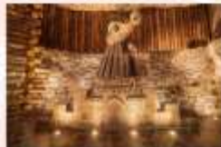
เหมืองเกลือวิลิชก้า