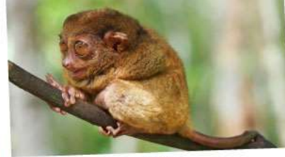
ลิงการ์เซียร์

21-24 ก.พ. 68 28 ก.พ.-03 มี.ค. 68 07-10, 14-17 มี.ค. 68 21-24, 28-31 มี.ค. 68 04-07 เม.ย. 68 (วันจักรี) 11-14 เม.ย. 68 (วันสงกรานต์) 18-21, 25-28 เม.ย. 68