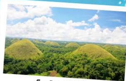
ช็อคโกแลตฮิลล์