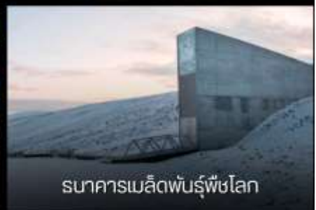
ธนาคารเมล็ดพันธุ์พืชโลก