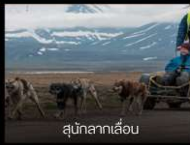
สุนัขลากเลื่อน