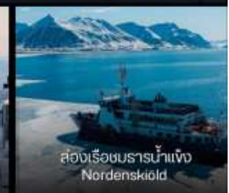
สองเรือชมธารน้ำแข็ง Nordenskiöld