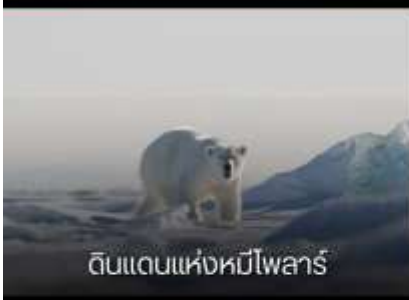
ดินแดนแห่งหมีโพลาร์