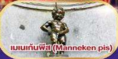
แมนกันพีส (Manneken pis)