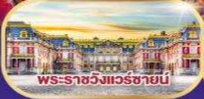
พระราชวังแวร์ซายน์