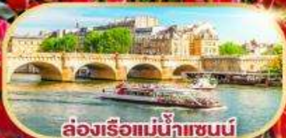
ล่องเรือแม่น้ำแซนน์