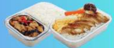
บริการอาหารร้อนบนเครื่อง ขาไป - ขากลับ