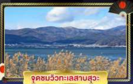
จุดชมวิวกะเลสาบสุวะ