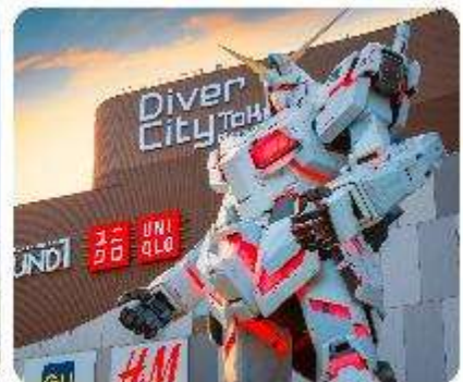
ย่านโอไดบะ ห้างไดเวอร์ซิตี ODAIBA SEASIDE PARK