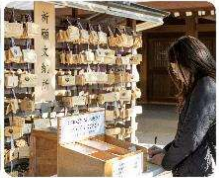
ศาลเจ้าเมจิจิงกู

ศาลเจ้าเมจิ หนึ่งในสถานที่อันศักดิ์สิทธิ์ใจกลางกรุงโตเกียว สิ่งแรกที่จะทำให้คุณประทับใจคือการเดินผ่านเสาโทริอิขนาดใหญ่ ระหว่างทางมีธรรมชาติที่ทำให้รู้สึกเหมือนก้าวเข้าสู่อีกโลกหนึ่ง ที่เต็มไปด้วยความสงบ อีกทั้งยังสามารถเขียนคำอธิษฐานลงบนแผ่นไม้ "เอมะ" เพื่อขอพรสำหรับความสุขและความสำเร็จในชีวิตอีกด้วย จากนั้นนำพาทุกท่าน...ซ็อบปังกันต่อใจกลางกรุงโตเกียว เมืองที่เป็นศูนย์กลางของแฟชั่นและนวัตกรรม และเปิดประสบการณ์การซ็อบปังที่ไม่เหมือนใคร! สักรวดย่านต่าง ๆ ที่แต่ละแห่งที่มีเสน่ห์และเอกลักษณ์อันโดดเด่น เมืองที่เต็มไปด้วยชีวิตชีวาและความทันสมัยที่หลากหลายอย่าง ย่านฮาราจุกุ แหล่งรวมแฟชั่นที่แปลกใหม่และสดใส เดินเล่นบน Takeshita Street ที่เต็มไปด้วยเสื้อผ้าและเครื่องประดับที่ไม่ซ้ำใคร เพลิดเพลินกับบรรยากาศสุดคูลที่เป็นเอกลักษณ์