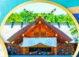
ศาลเจ้าออกโทโด