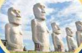
มิงเกิ้ลเทอเรส