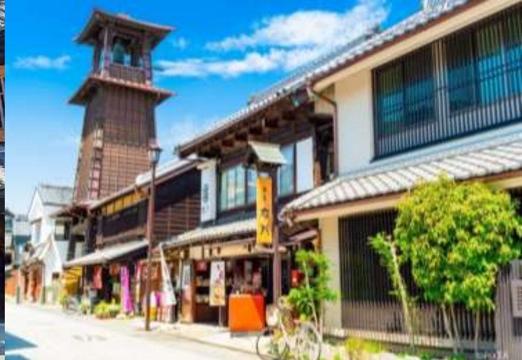
หน้าถนนเดินทางสู่ “เมืองคาวาเกะเอะ” บนเมียงเสกุงุ ใน

จังหวัดไซตามะ เป็นหนึ่งในสถานที่ท่องเที่ยวที่มีเสน่ห์มากที่สุดในแถบชานเมืองโตเกียว เป็นสถานที่ที่เหมาะสมสำหรับสัมผัสกับบรรยากาศญี่ปุ่นแบบดั้งเดิม ซึ่งมีทั้งสถาปัตยกรรมเก่าแก่ และวัฒนธรรมท้องถิ่นที่สามารถย้อนรอยไปในยุคเอโดะได้อย่างแท้จริง เป็นสถานที่ท่องเที่ยวที่ไม่ควรพลาดสำหรับคนที่ต้องการหลีกเลี่ยงความวุ่นวายของเมืองใหญ่และสัมผัสกับบรรยากาศแบบญี่ปุ่นดั้งเดิม