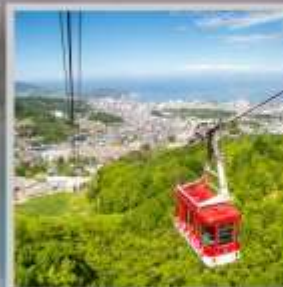
"MT. TENGU ROPEWAY"