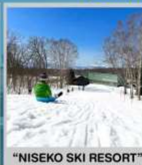
"NISEKO SKI RESORT"