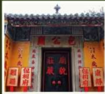
วัดเปากง