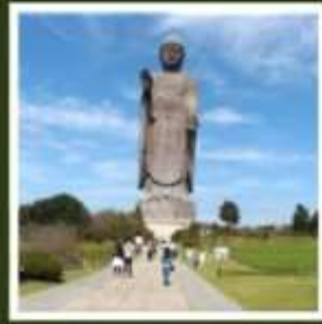
พระพุทธรูปอชิคุไดบุทสึ