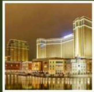
เดอะ เวเนเชียน

ฟูจิยามะ ทาวเวอร์ ขึ้นชมฟูจิจากสวนสนุกที่ไม่เหมือนใคร ชมไร่ชาโอบุจิชะชะบะ อันเลื่องชื่อ