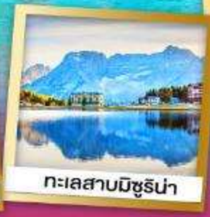
ทะเลสาบมิซูรีน่า