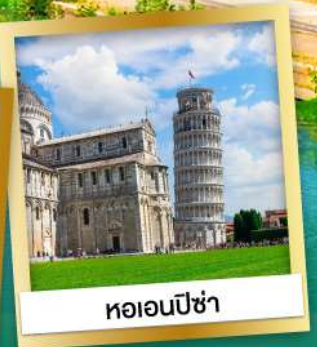
หอเอนปิซ่า