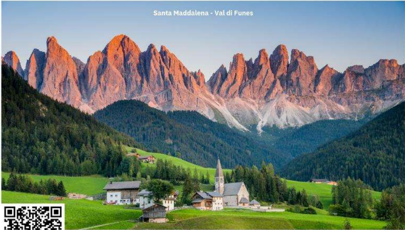
Santa Maddalena - Val di Funes

จากนั้นนำท่านเดินทางสู่ ชุมชน Val di Funes ใช้เวลาเดินทางประมาณ 1.30 ชั่วโมง ชุมชนเล็กๆ ทางภาคตะวันตกของอุทยานโดโลไมต์ ประกอบไปด้วยหมู่บ้านเล็กๆ 6 หมู่บ้าน โดยมีชื่อเสียงจากการมีวิวทิวทัศน์ที่สวยงามที่สุดในเขต South Tyrol อีสระให้ท่านเก็บภาพความประทับใจ จากนั้นนำท่านเก็บภาพความประทับใจอีกหนึ่งสถานที่ ณ โบสถ์ Santa Maddalena โบสถ์ที่ถือเป็นสถานที่ไฮไลท์ที่ถูกถ่ายรูปมากที่สุดในอุทยานโดโลไมต์ มีวิวทิวทัศน์ที่สวยงามมีฉากหลังเป็นเทือกเขา Odles (การเดินทางขึ้นไปเก็บภาพความประทับใจนี้ ท่านจะต้องเดินขึ้นลงเนินไปและกลับประมาณ 2 กิโลเมตร เพื่อไปเก็บภาพ)