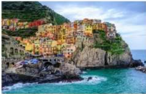
ซิงเคว เทเร

จากนั้นนำท่านเดินทางต่อด้วยรถไฟ สู่หมู่บ้านมรดกโลกและอุทยานแห่งชาติ ซิงเคว เทเร Cinque Terre อ่านว่า ซิงเควเทเร หรือแปลในความหมายตามภาษาอังกฤษก็คือ The Five Land แดนมหัศจรรย์ทั้ง 5 ที่ประกอบกันขึ้นมาเป็นดินแดนแห่งความงดงาม หมู่บ้านเล็กๆ 5 หมู่บ้านที่ซ่อนตัวอยู่ห่างไกลจากสายตาของคนภายนอก แผ่นดินที่ยากจะเข้าถึงได้โดยง่าย หมู่บ้านเล็กๆ 5 หมู่บ้านที่ตั้งเรียงอยู่มีห่างกัน