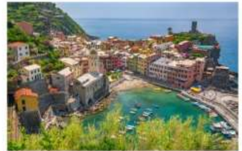
ซิงเคว เทเร

นำคณะเที่ยวชม ซิงเคว เทเร เป็นพื้นที่ที่ UNESCO ประกาศให้เป็นมรดกโลก ด้วยทำเลที่ตั้งของทั้งหมดอยู่บนภูเขาสูง โดมมีหน้าผาสูงชัน และทะเลกว้างใหญ่เป็นฉากหน้า ทำให้มีความสวยงามประดุจดั่งภาพวาด จึงเป็นอุปสรรคสำหรับผู้คนจากภายนอกในการที่จะเข้าไปให้ถึง แต่ในแง่ดีก็คือ หมู่บ้านทั้งห้ายังคงสภาพดั้งเดิมของมันมาได้ตั้งแต่ศตวรรษที่ 11 ประกอบไปด้วย Monterosso al Mare (มอนเตรอสโซ อัล มาเร), Vernazza (เวร์นาซซา), Corniglia (คอร์นีเลีย) , Manarola (มานาโรลา) และ Riomaggiore (ริโอมัจจอร์เร) **ทางบริษัทจะนำทุกท่านเที่ยวอย่างน้อย 1 จากใน 5 หมู่บ้าน**