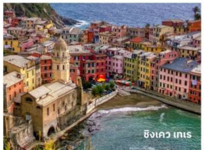
ซิงเคว เทเร

ท่านสามารถทำการสแกน QR CODE นี้ เพื่อรับชม “ซิงเควเทเร” ในรูปแบบวิดีโอ