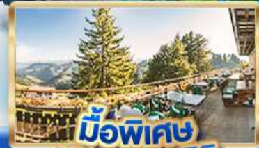
มือพิเศษ บียอดเวาริคิ