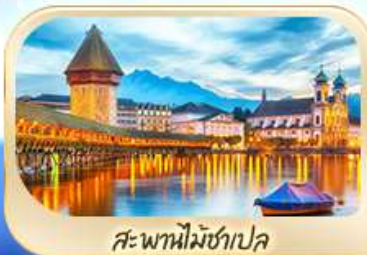
สะพานไมซ์ฮาเปล