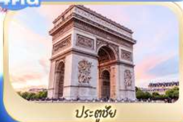
ฝรั่งเศส