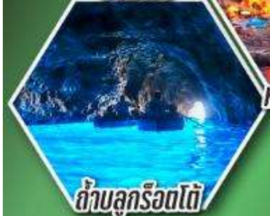
ถ้ำบลูกรอตโต้