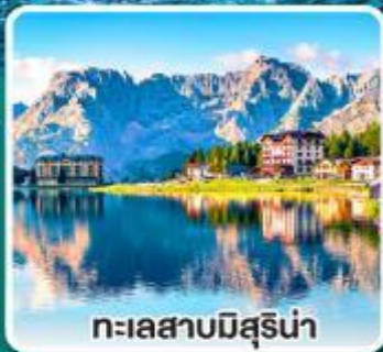
ทะเลสาบมิสุรีน่า

เข้าชมมหาวิหารเซนต์ปีเตอร์ ที่ใหญ่ที่สุดในโลกแห่งนครวาติกัน