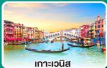
เกาะเวนิส