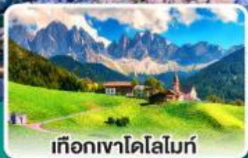
เทือกเขาโดโลไมท์