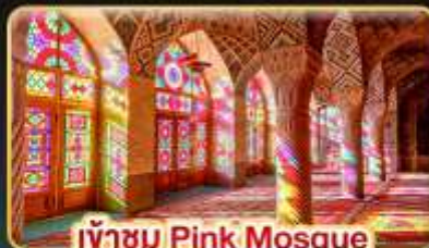
เข้าชม Pink Mosque