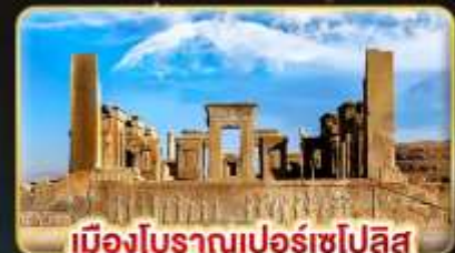
เมืองโบราณเปอร์เซโปลิส

✈️ บินตรง กรุงเทพฯ - เตหะราน บินภายใน ชีราซ - เตหะราน