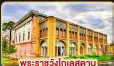
พระราชวังโกเลสถาน