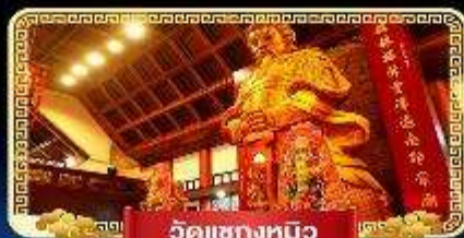
วัดเข่งหมิว