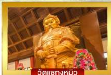
วัดแซงกวมิ้ว