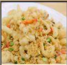
หมึกทอดกระเทียม