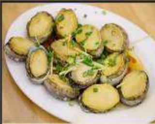
เปาฮื้อสดนึ่ง