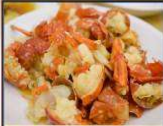
กุ้งมังกรอบซีส