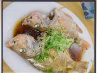
ปลาหนึ่งซีอิ๊ว