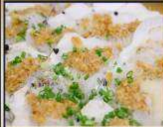
หอยเชลล์อบวุ้นเส้น