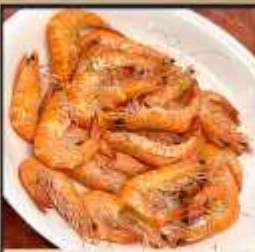
กุ้งหวานลวก