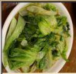
ผัดผักตามฤดูกาล