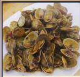
ผัดหอยลาย