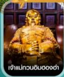
เจ้าแม่กวนอิมอองฮ่า