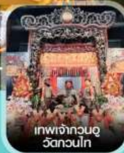
เทพเจ้ากวนอู วัดกวนไท่

✈️ คอนเฟิร์มออกเดินทาง ทุกพีเรียด 2 ท่านขึ้นไป ✈️