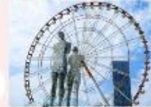
รูปปั้นอาลีและนีโน