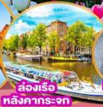
ล่องเรือ หลังคากระจก