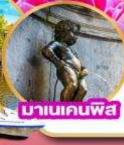
มานเคนพิส