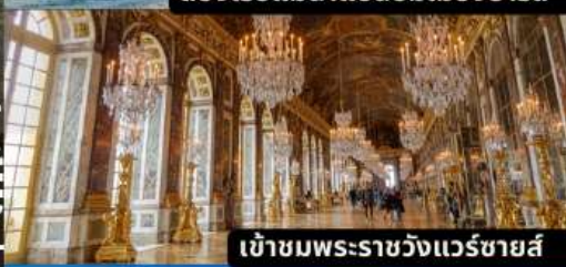
เข้าชมพระราชวังแวร์ซายส์