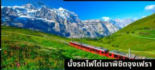
นั่งรถไฟใต้เขาพิชิตดงเฟรา