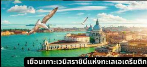
เยือนเกาะเวนิสราชมินแห่งทะเลเอเดรียติก