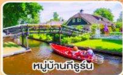
หมู่บ้านกังธูร์น