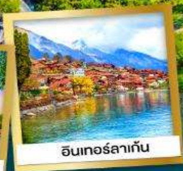
อินเทอร์ลาเก้น