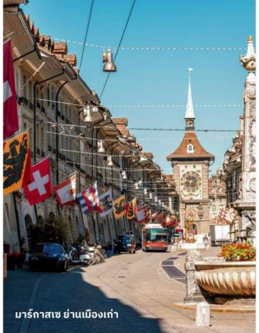
มาร์กาซเซ ย่านเมืองเก่า

ปัจจุบันเต็มไปด้วยร้านดอกไม้และบูติก เป็นย่านที่ปลอดภัยจนดี จึงเหมาะกับการ เดินเที่ยวชมอาคารเก่า อายุ 200-300 ปี