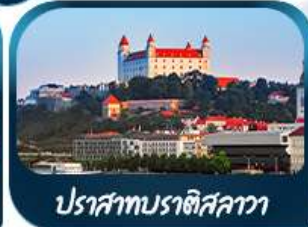
ปราสาทบราติสลาวา